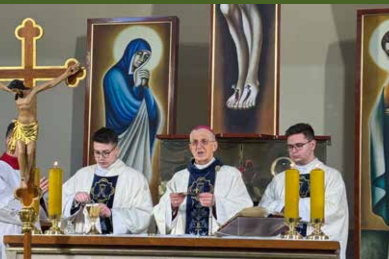
Diecezjalny Kurs Ceremoniarza, 07.02.2026