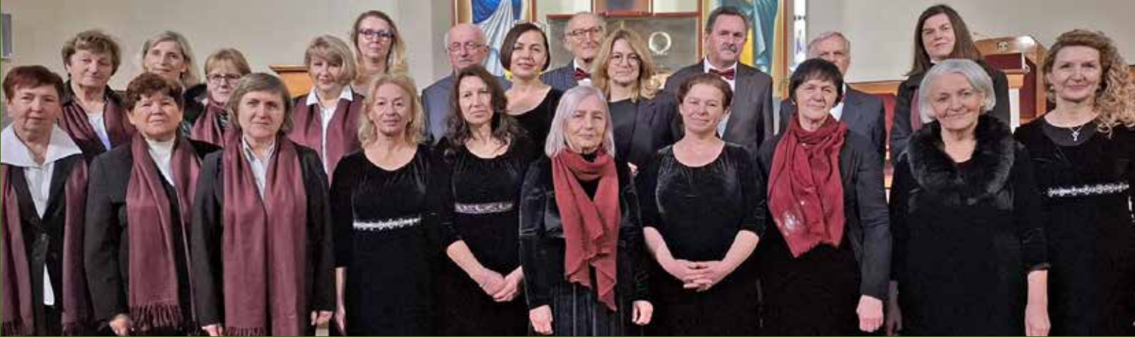
Połączone chóry Parafii Narodzenia NMP w Dąbrowicy oraz Parafii św. Rodziny w Lublinie