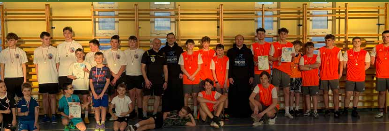
Dekanalny etap Mistrzostw LSO w piłce halowej, 13.03.2026