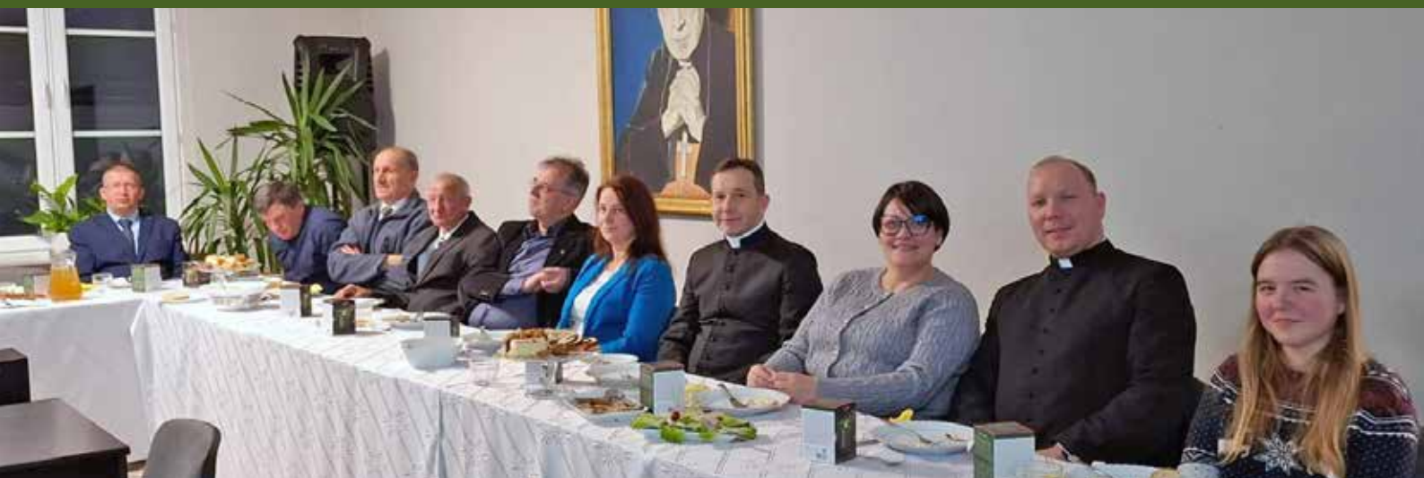
Spotkanie świąteczne Radnych i Pracowników Parafii, 27.12.2025