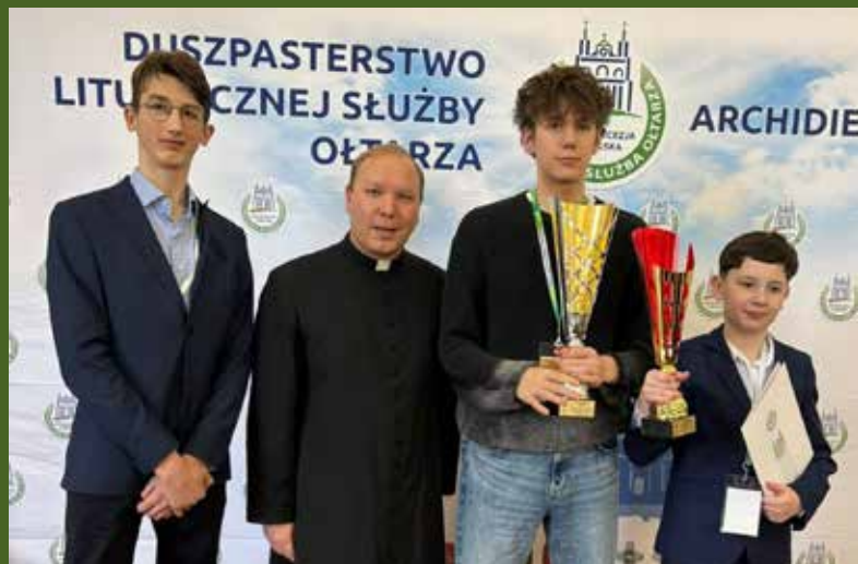
II Finał Konkursu Wiedzy Liturgicznej AL, 15.02.2026