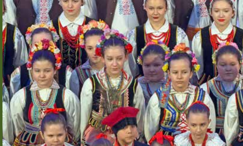
Koncert kolęd ZPiT Dąbrowica, 11.01.2026