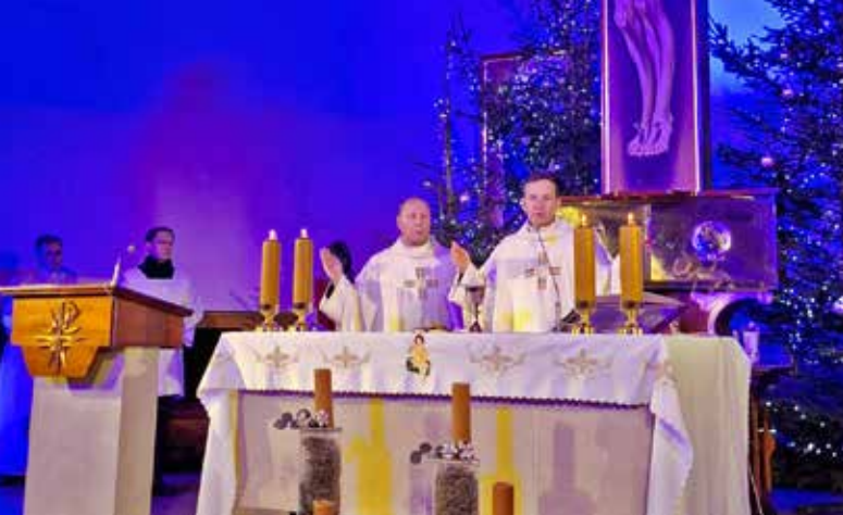
Zakończenie roku AD 2025, 31.12.2025