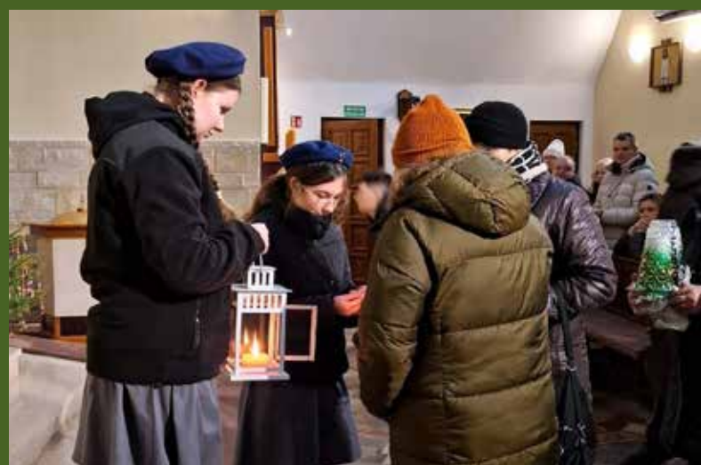
Betlejemskie Świeciło Pokoju, 24.12.2025