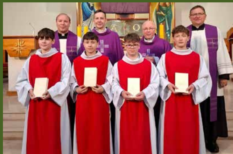
Ustanowienie nowych lektorów, 20.03.2026