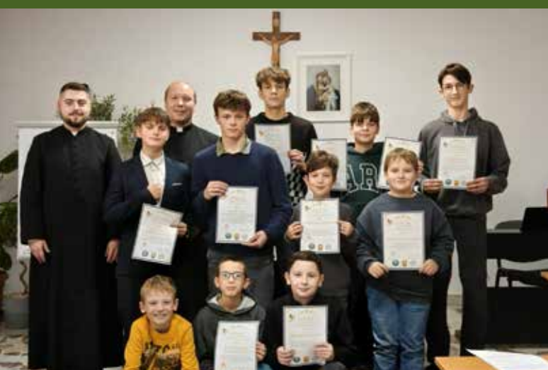
Dekanalny Konkurs Wiedzy Liturgicznej, 21.12.2025