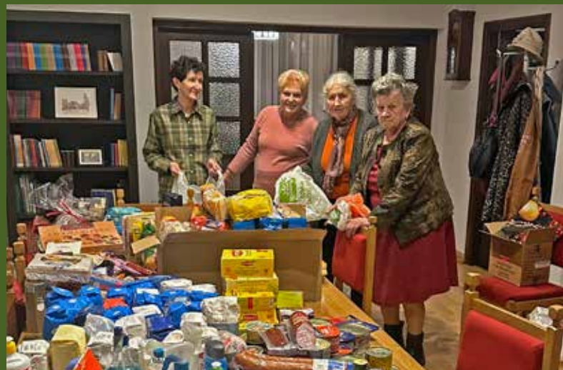
Przygotowanie świątecznych darów dla ubogich, 19.12.2025