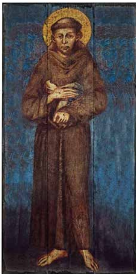
Cimabue, portret św. Franciszka z Asyżu

Niedługo później, modląc się w zrujnowanym kościółku San Damiano w Asyżu, usłyszał w sercu słowa Chrystusa: „Franciszku, napraw (uratuj) mój