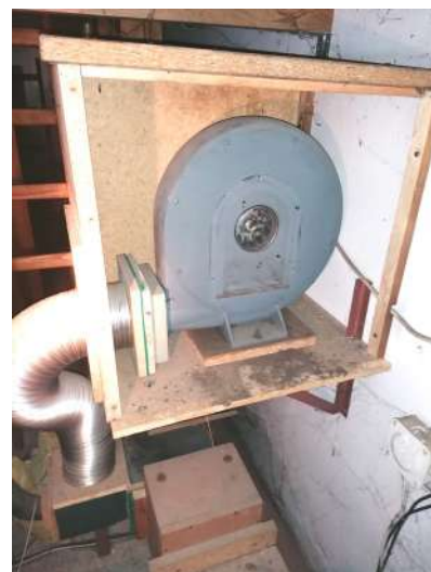
Wykruszona gąbka czepni dmuchawy elektrycznej we- wnątrz skrzyni głośzącej

Jeżeli powyższy opis jest skomplikowany a prezentowane liczby wydają się wysokie to w pełni uzasadnione jest nazywanie organów królem instrumentów.