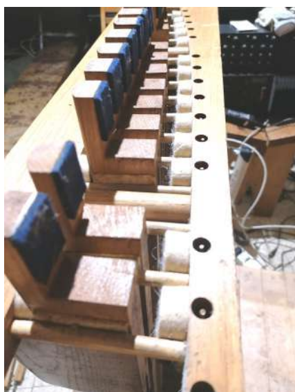
Nowe filce tłumiące w klawia- turze nożnej