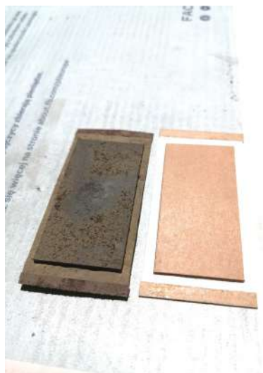
Porównanie mieszków: stary i nowy