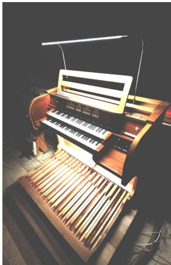
Kontuar po wyczyszczeniu i z zamontowanym nowoczesnym oświetleniem

W naszym kościele znajdują się organy produkcji niemieckiej translokowane i zamontowane w roku 2000. Mają 12 głosów, czyli zestawów piszczałek o jednakowej budowie, barwie, stopaży. Charakter ich brzmienia wpisuje się w styl muzyki barokowej, dzięki temu z powodzeniem można na nich realizować akompaniament liturgiczny.