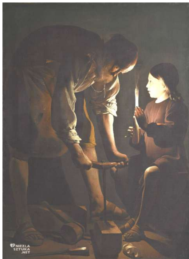
Georges de La Tour, Święty Józef cieśla , ok. 1642