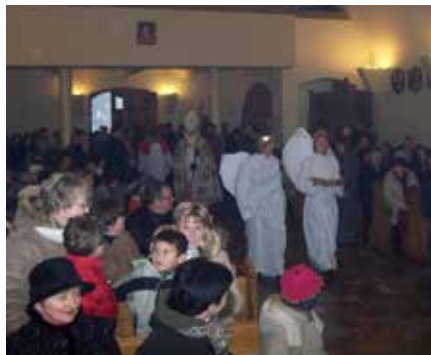
Nie tylko dzieci wypatrywały niezwykle oczekiwanych Gości