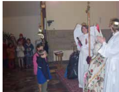
Nasi Milusińscy są grzeczni więc św. Mikołaj dla każdego z nich miał jakiś upomek