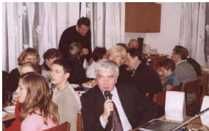
Komputer też pomaga nam chwalić Pana... Kolędy z karaoke, a czemuż nie?