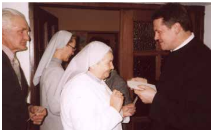
Biały oplątek łączy nas wszystkich

Dnia 6 stycznia po Mszy św. o godz. 18.00 członkowie wspólnot działających przy parafii spotkali się na dorocznym życzeniach i dzieleniu się oplątkiem. (red)