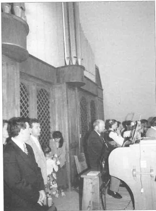
Uroczystości jubileuszowe 50-lecia parafii