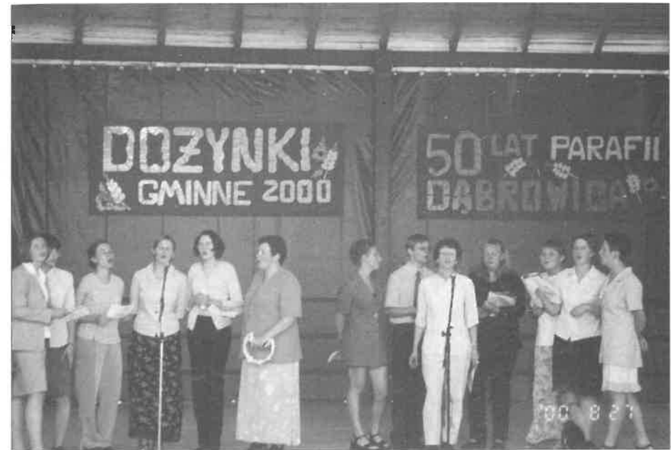
Festyn z racji jubileuszu parafii

Adres: Kancelaria Parafialna, Dąbrowica 132, 21-008 Tomaszowice. Tel. (81) 50-20-893. Nakład 600 egz. Skład i druk: WOF Niepokalanów.