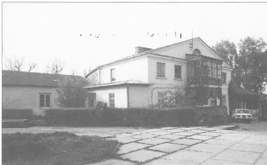
Kaplica i plebania do roku 1990