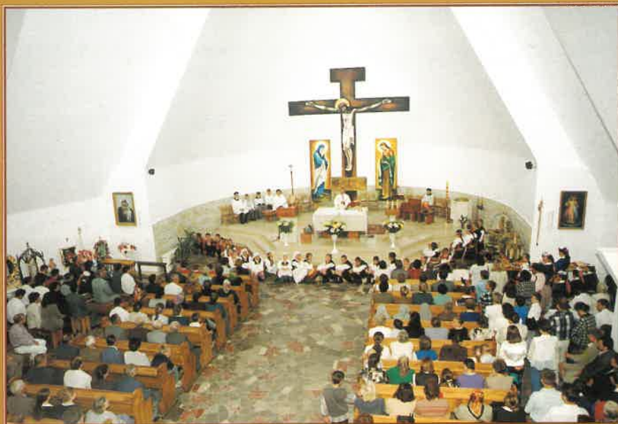
Wnętrze nowego kościoła