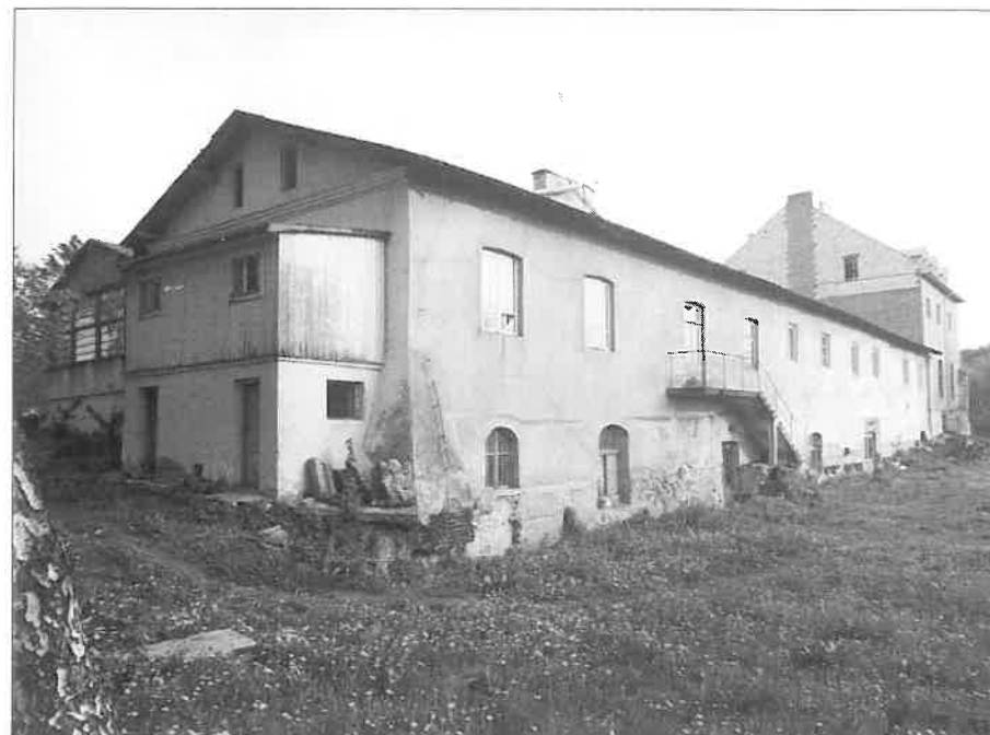
Kaplica od strony zachodniej