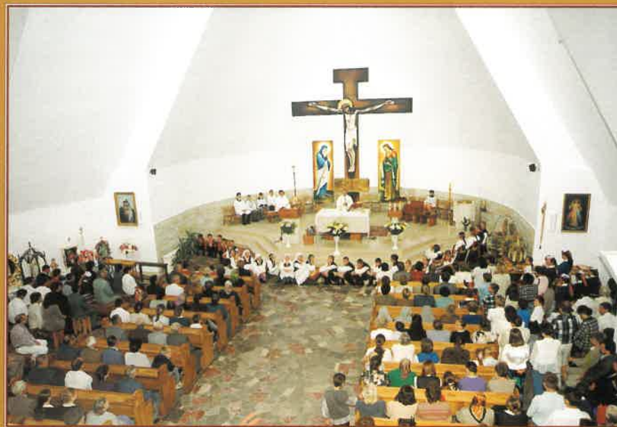
Wnętrze nowego kościoła