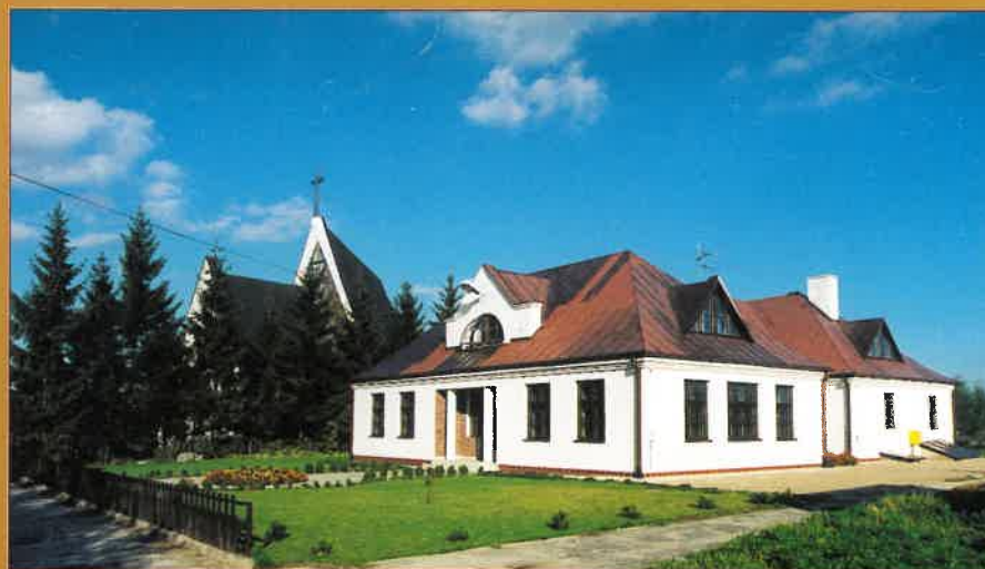
Dom parafialny w Dąbrowicy