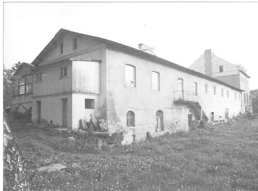
Kaplica od strony zachodniej

ECHO DĄBROWICY. Pismo parafii Narodzenia NMP w Dąbrowicy. Redaguje zespół: Cezary Taracha, Jolanta Golas, s. Teresa FMM, ks. Zygmunt Lipski. Adres: Kancelaria Parafialna, Dąbrowica 132, 21-008 Tomaszowice, tel. 50-20-893. Nakład 500 egz. Skład i druk: WOF Niepokalanów, 96-515 Teresin.