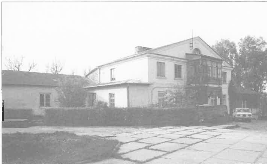
Kaplica i plebania do roku 1990